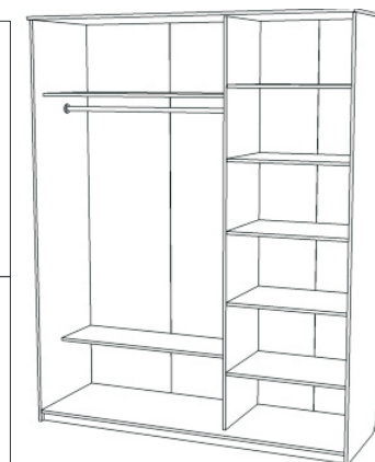
Изделие в сборе без рельсов и дверей